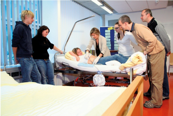
Pflegeausbildungen am BFI sind gut gebucht

Mit Ausnahme der Werkmeisterschulen weiteten die BFIs ihre Bildungsaktivitäten in allen Fachbereichen aus. Neben der überbetrieblichen Lehrausbildung und dem zweiten Bildungsweg zur Vorbereitung auf schulische und berufliche Abschlüsse legen die BFIs immer schon einen Schwerpunkt auf den Bereich Technik/Ökologie/Sicherheit. 2021 stiegen die Teilnahmen um 18 % und damit die Auslastung der Schulungszentren, die vor allem der Fachkräfteausbildung dienen. Mit fast 28.000 Teilnahmen und Angeboten in 24 verschiedenen Sprachen war das BFI wieder eine der größten Sprachenschulen des Landes.