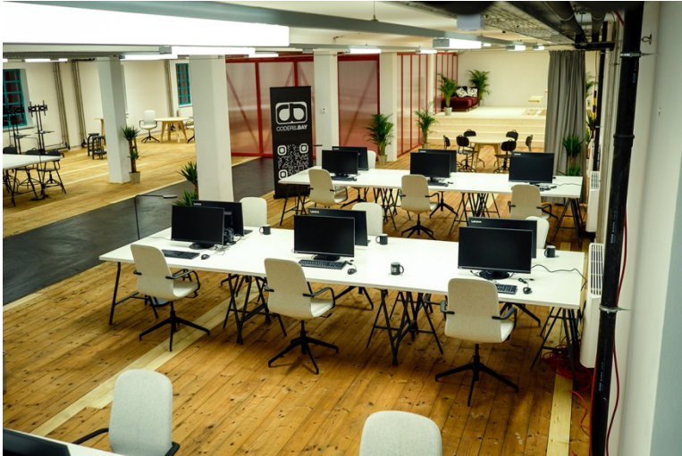
Lernfreundliches Setting in der CODERS.BAY